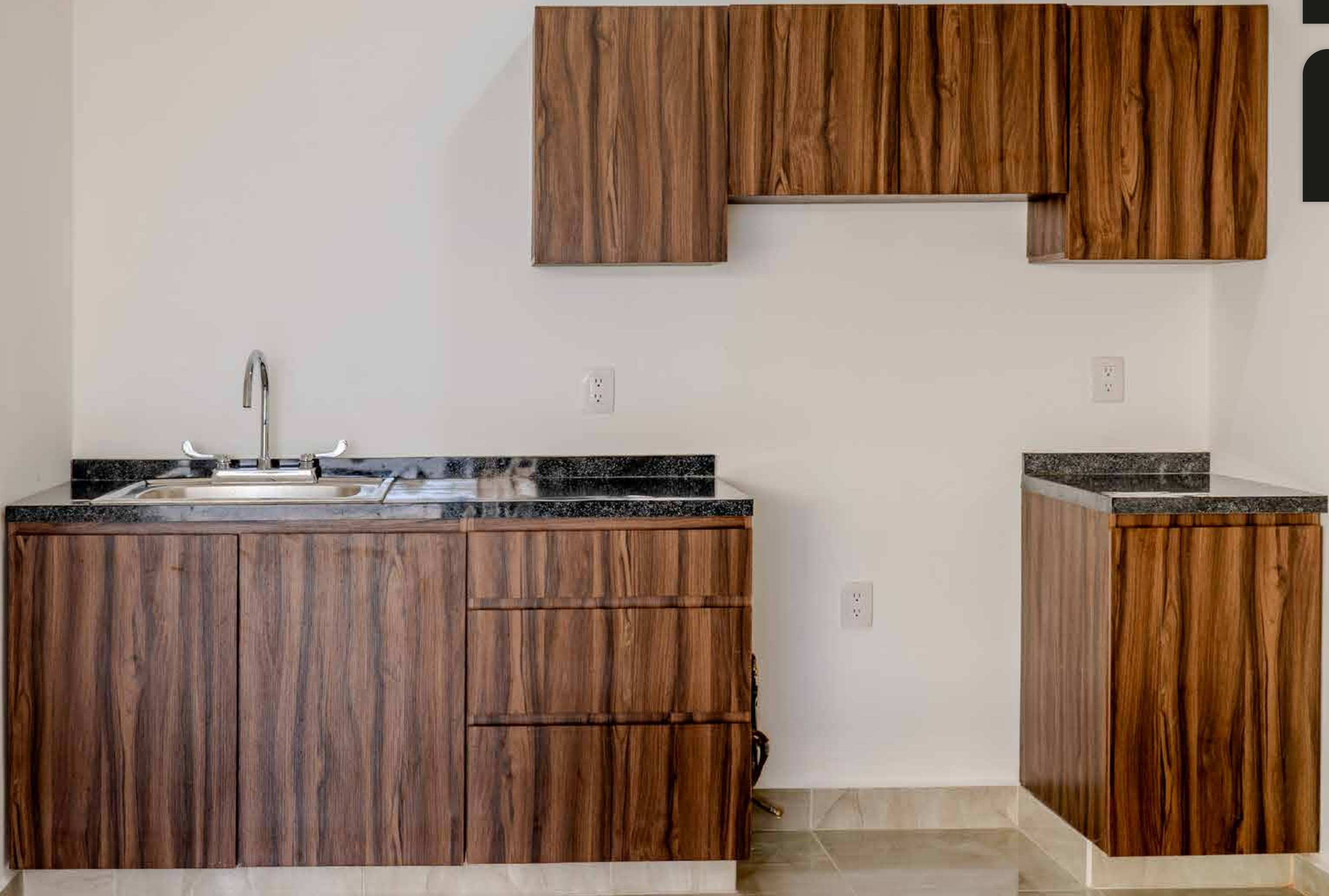
Ribera del Ebro - Cocina