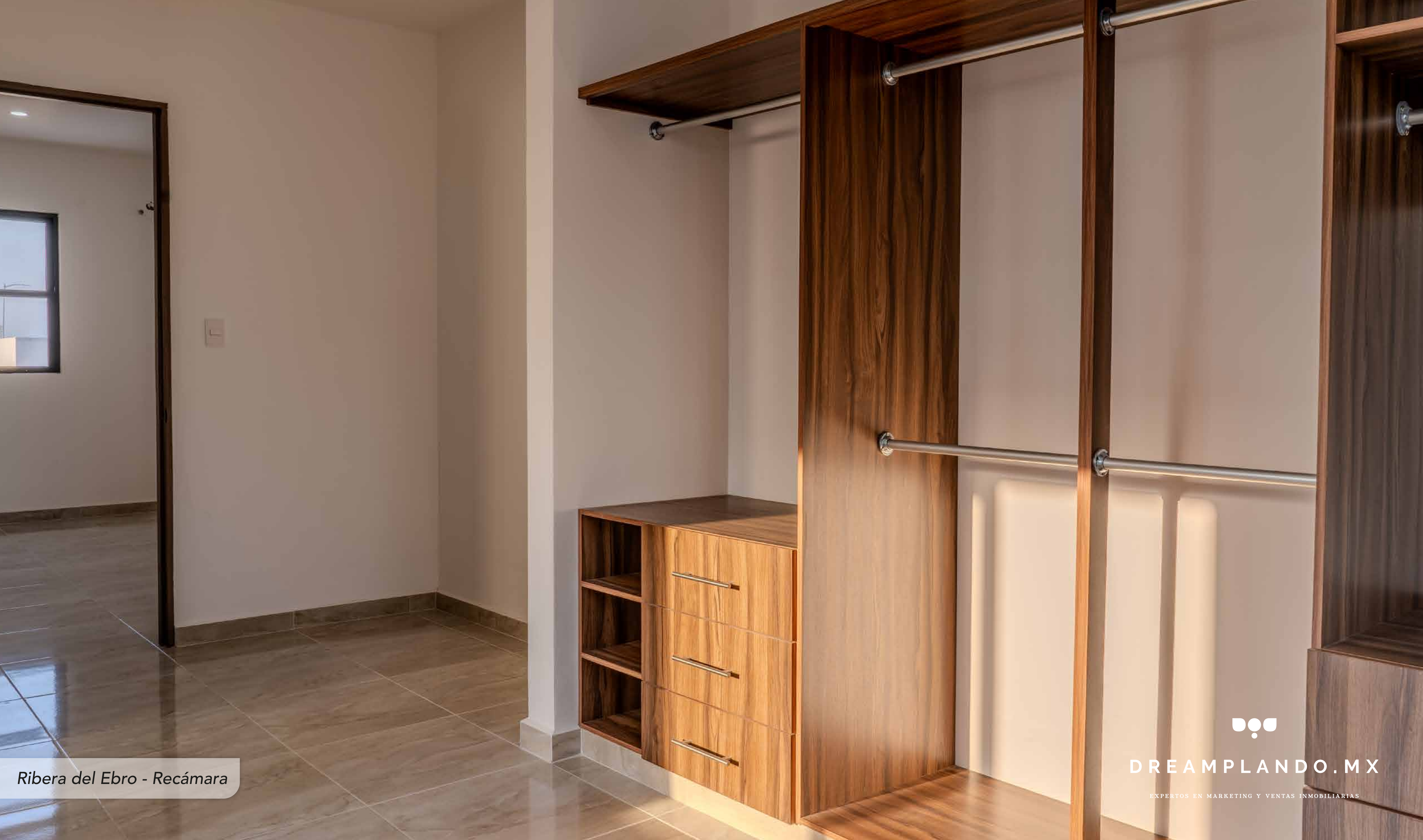
Ribera del Ebro - Recámara