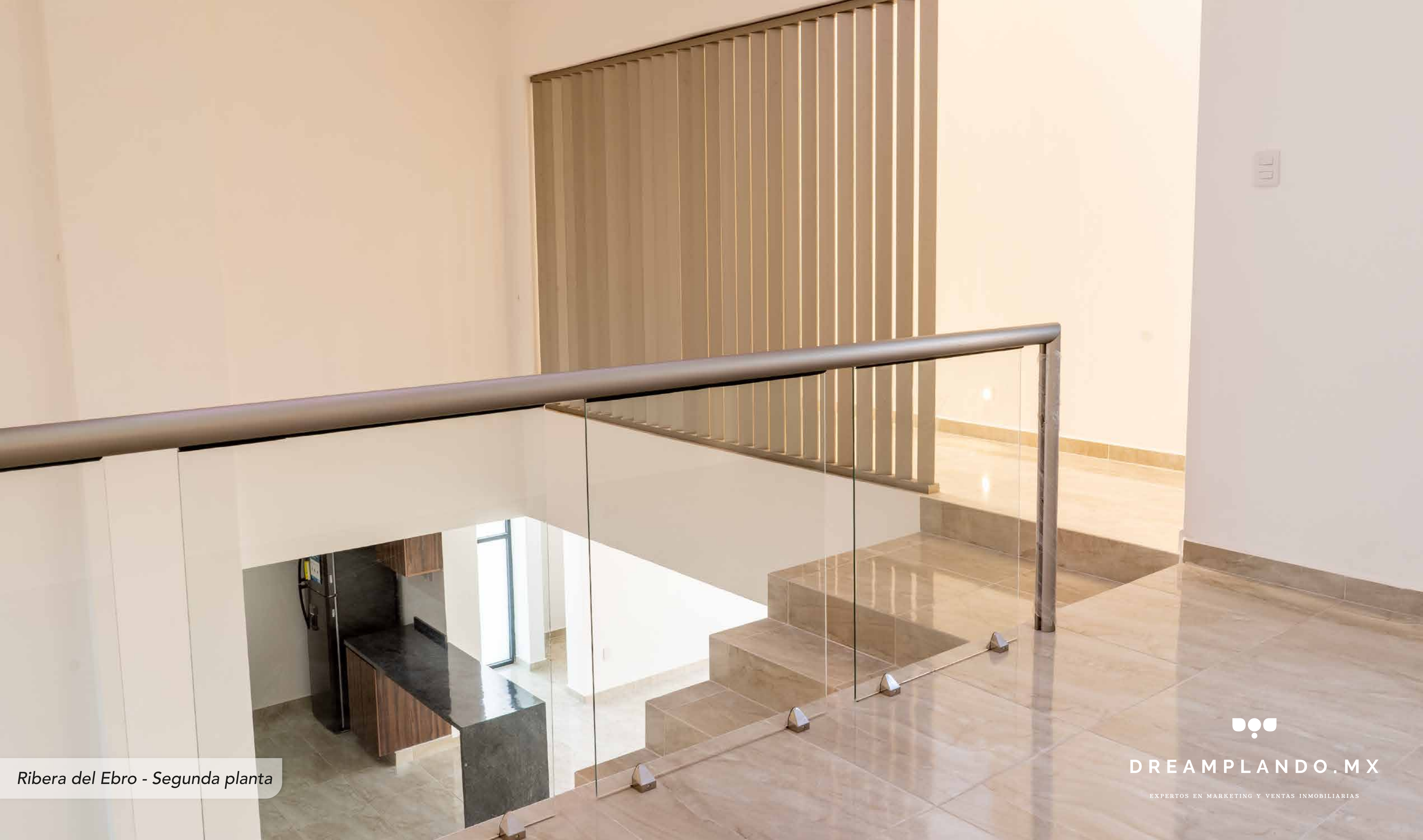
Ribera del Ebro - Segunda planta