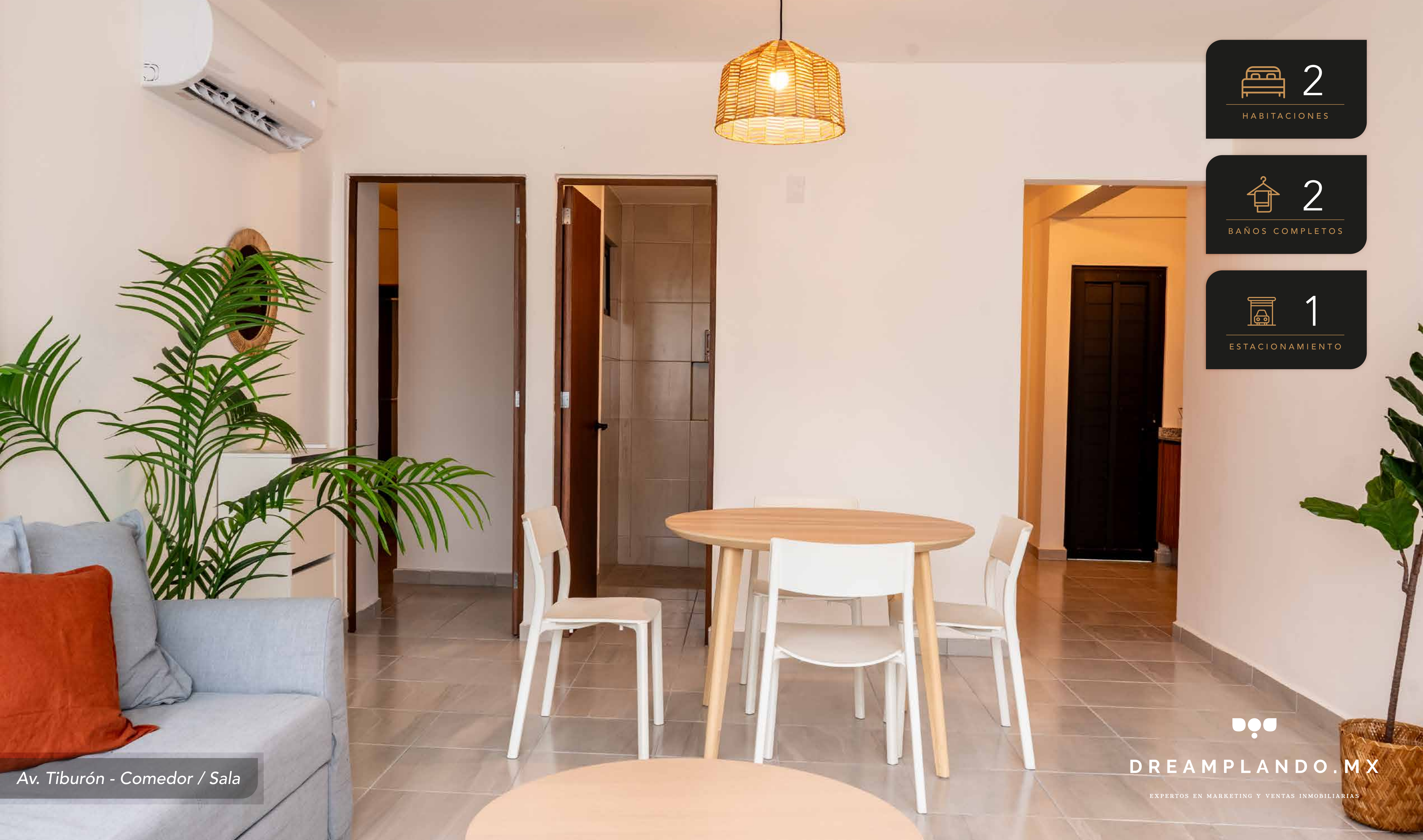
Av. Tiburón - Comedor / Sala