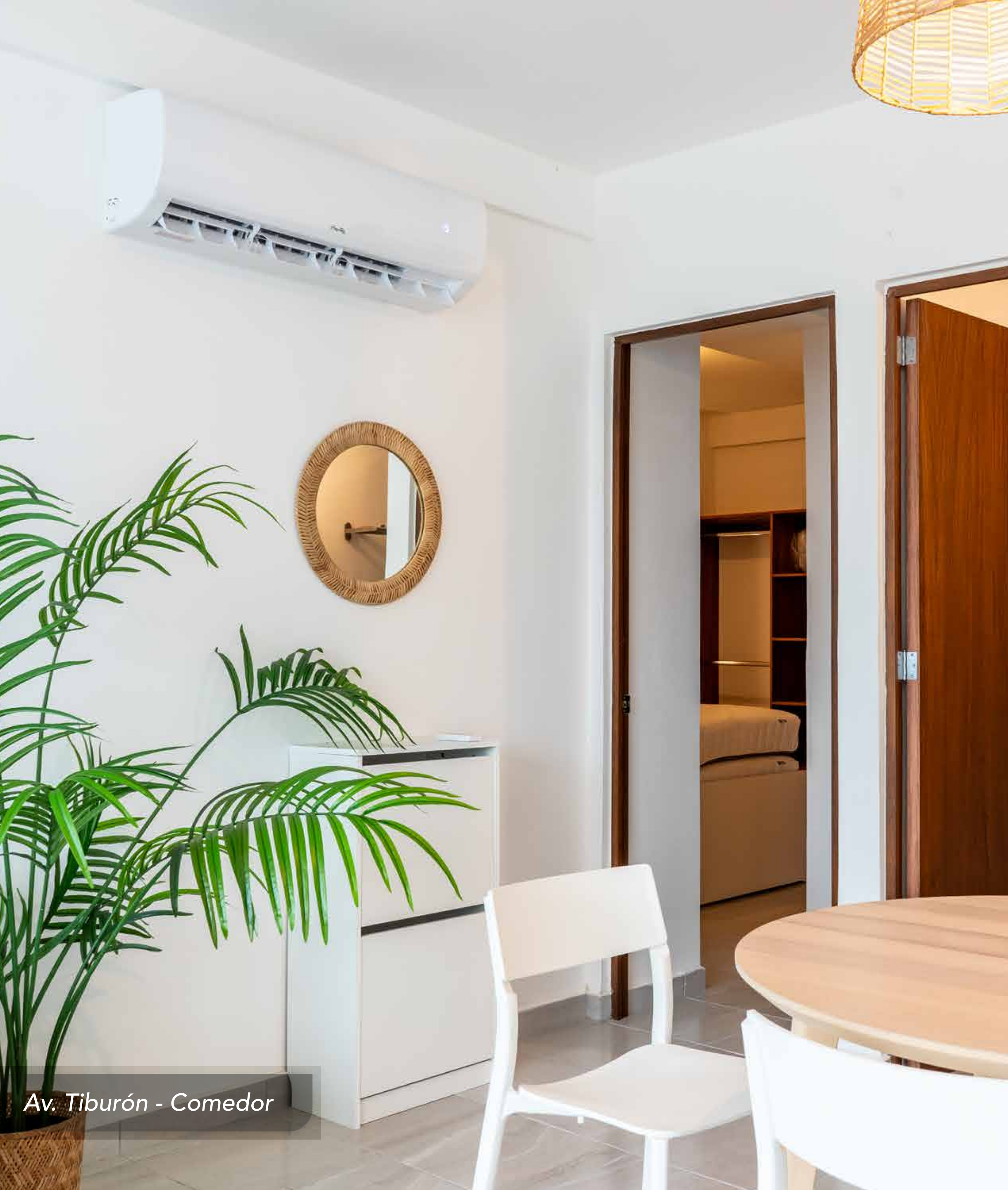
Av. Tiburón - Comedor