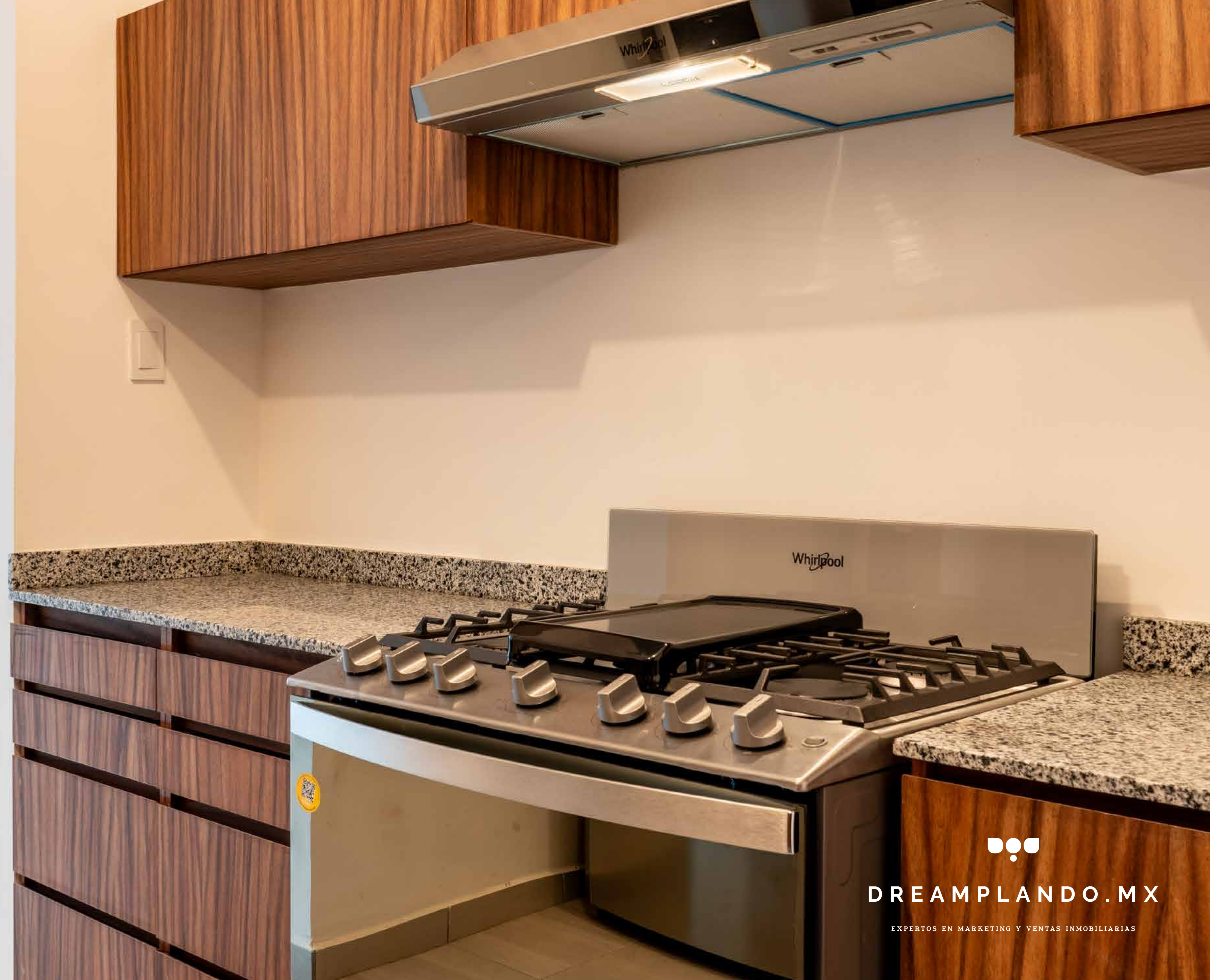
Av. Tiburón - Cocina