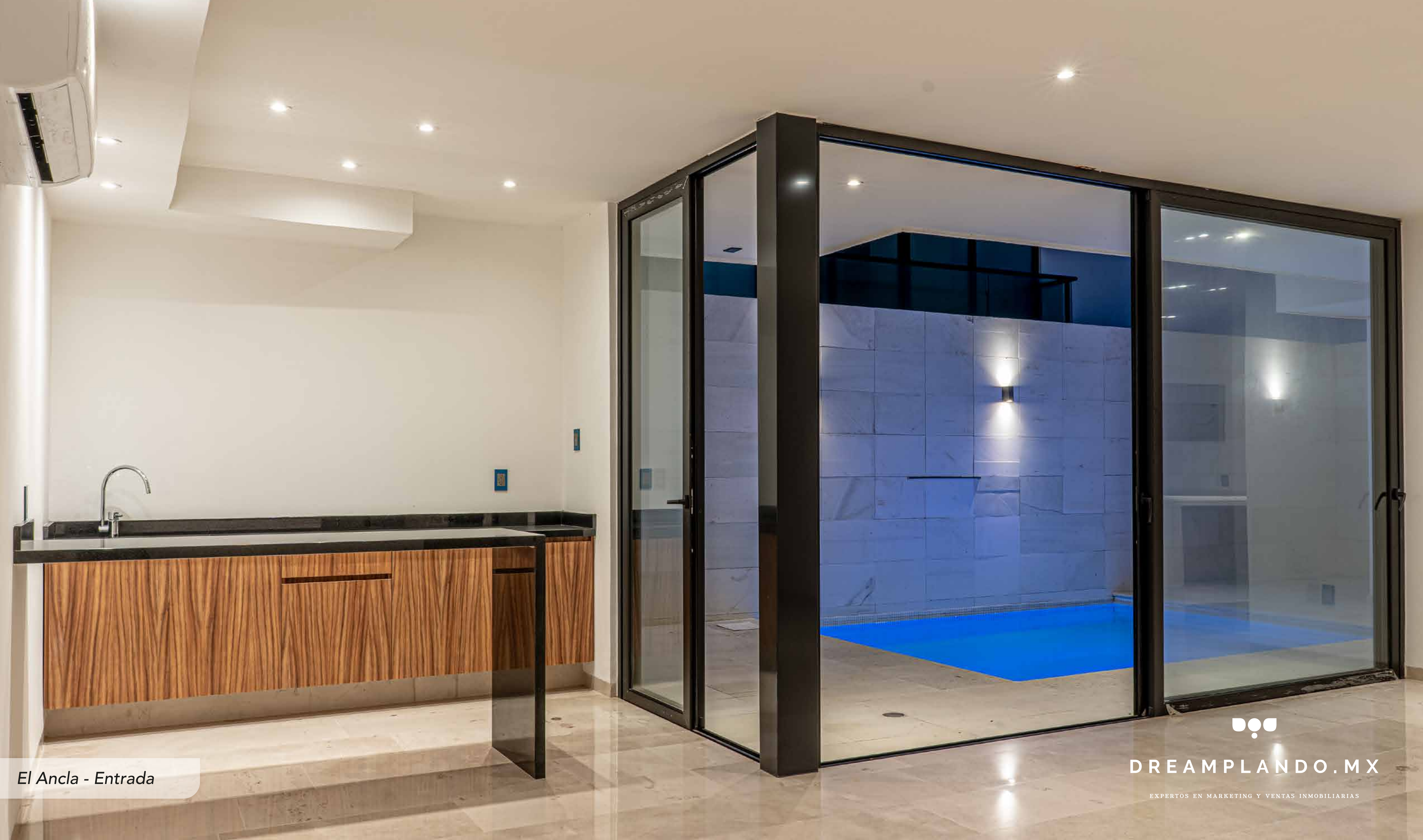
El Ancla - Entrada