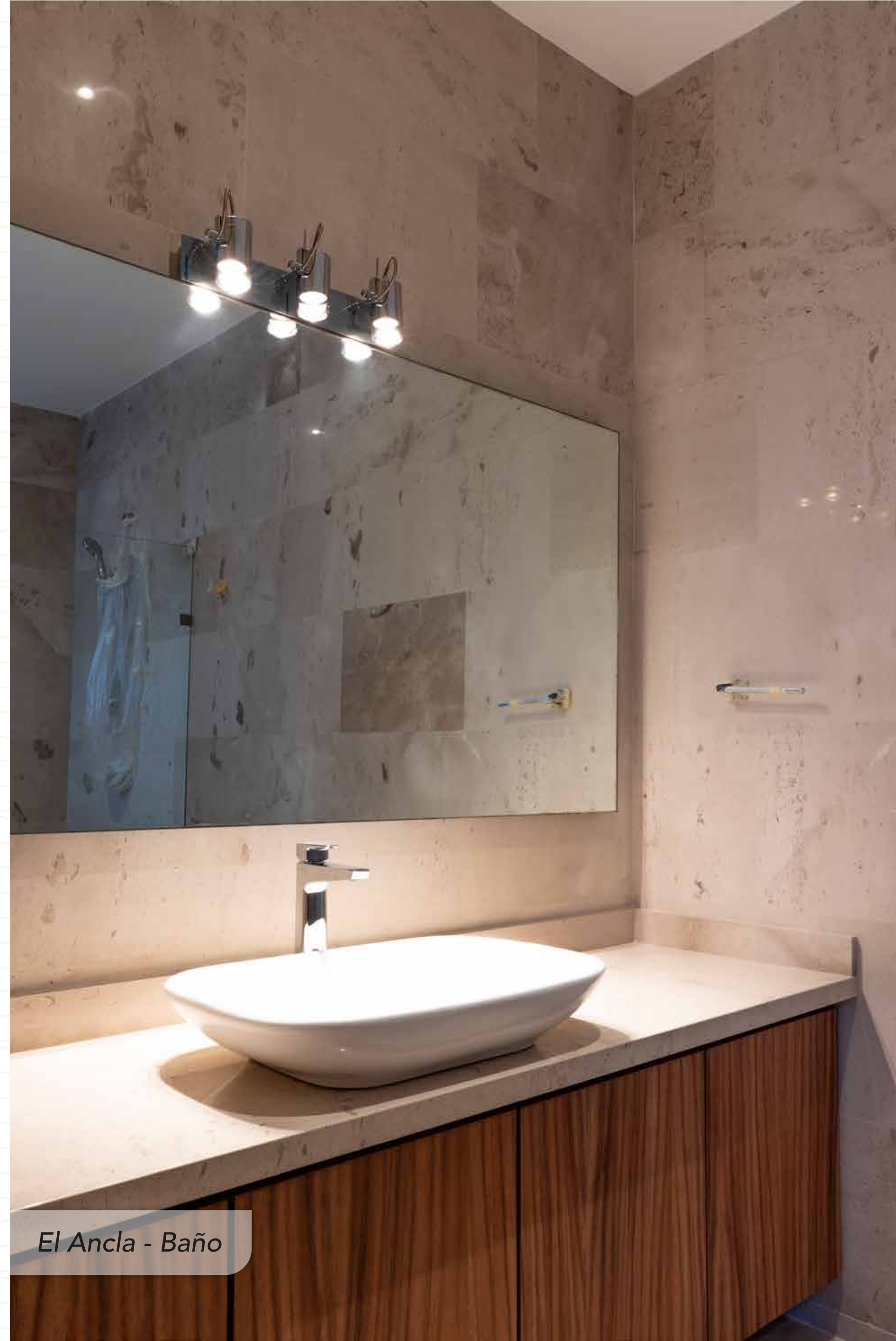
El Ancla - Baño