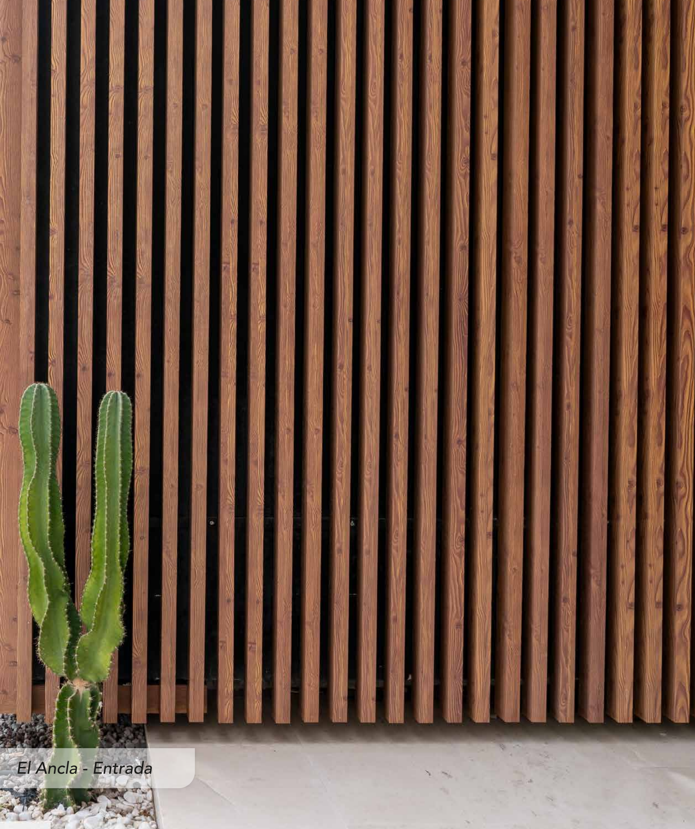
El Ancla - Entrada