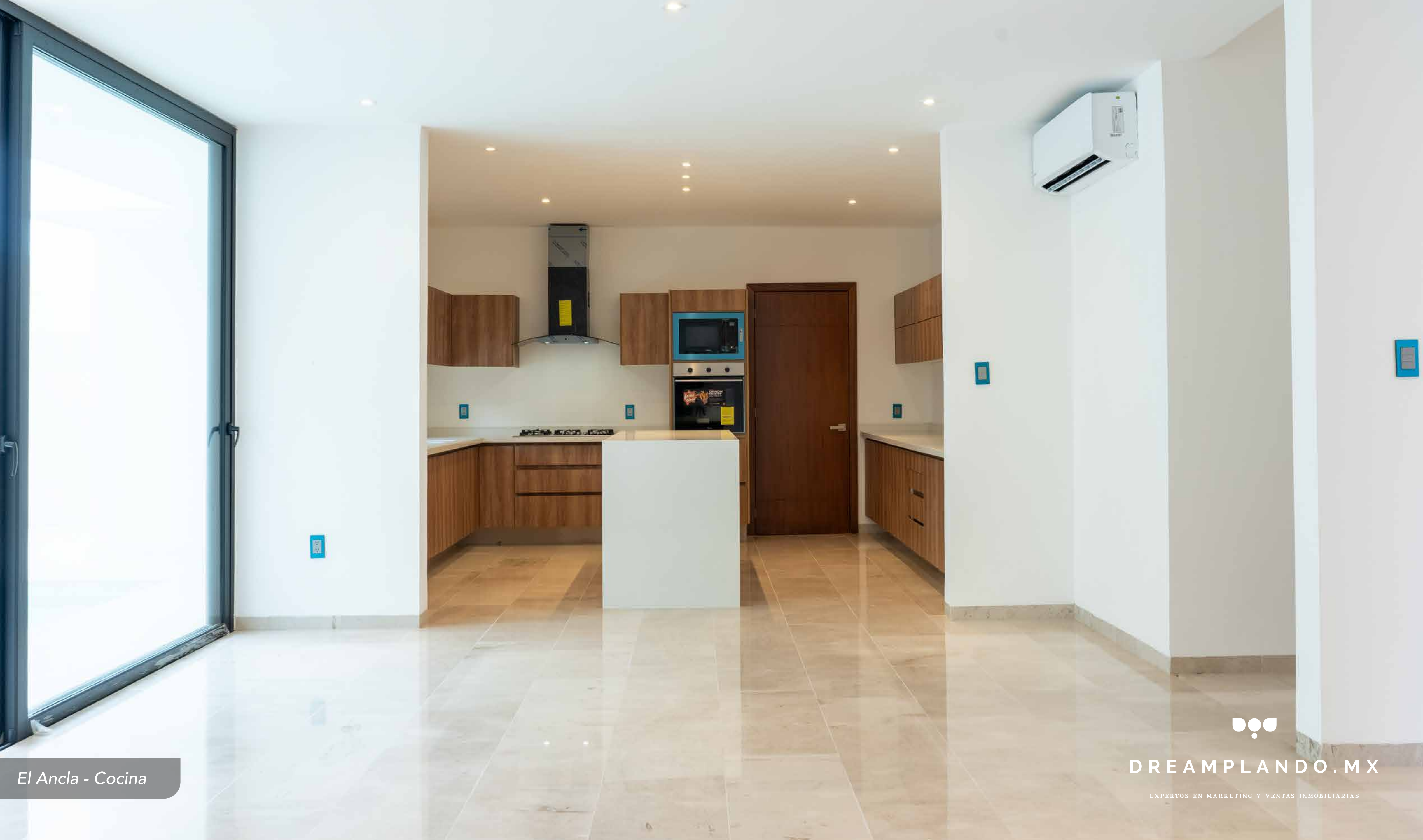
El Ancla - Cocina